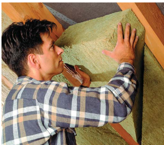
Tetőtéri hőszigetelés Rockwool Deltarock PLUS éklemekkel: beillesztés