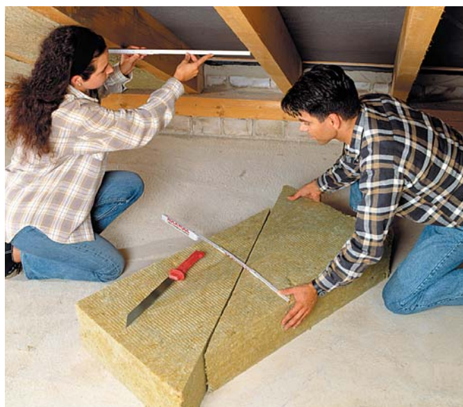
Tetőtéri hőszigetelés Rockwool Deltarock PLUS éklemekkel: mérés