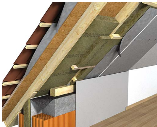
Tetőtéri hőszigetelés Rockwool Deltarock PLUS éklemekkel: rétegrend a szarufák alatt

A Rockwool Hungary Kft. munkatársai szívesen állnak hőszigeteléssel kapcsolatos információkkal az érdeklődők rendelkezésére (telefon: 06 1 225 2405, e-mail: info@rockwool.hu). (x)