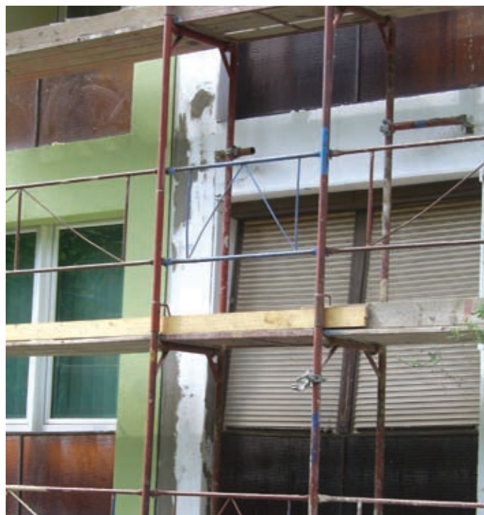
Az utólagosan szabálytalanul beépített loggiák között nincs meg a 1,3 méteres tűzvédelmi gát! Incediu – Építkezés: 15 perc alatt leégett a homlokzat