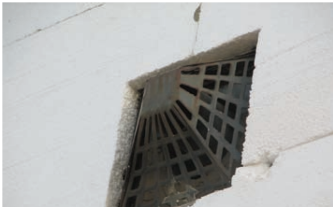
Parapet konvektorok égéstermék elvezetői szabálytalanul kialakítva

A parapet konvektorok és egyéb készülékek homlokzaton átvezetett égéstermék elvezetőinek nem megfelelő kialakítása is veszélyt hordozhat.