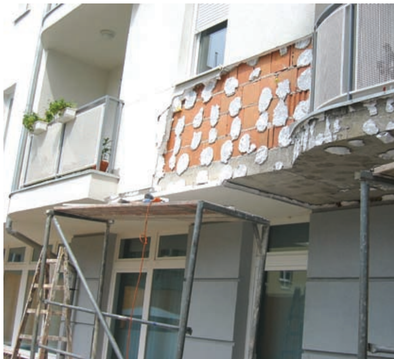
Gyenge dűbelezés – elégtelen védelem

Az egyik lehetséges megoldás, az engedélyezés és hatósági átvételi eljárás szigorítása. A másik az építkezések kivitelezés közbeni ellenőrzése, különös tekintettel a középmagas épületekre. Ez lehet szakhatóság vagy független minősítő intézet. Talán egy ennél egyszerűbb, ellenőrizhetőbb és majdnem az összes hibalehetőség és veszély kiküszöbölésére alkalmas megoldás az a Nyugat-Európában is alkalmazott módszer, hogy az éghető besorolású homlokzati hőszigetelő rendszereknél a homlokzati nyílászáróknál (szemöldök részen vagy keret jelleggel) vagy az épületen körbe futó sávban tűzvédelmi sávokat alakítanak ki. A tűzvédelmi gát kialakításokat természetesen az épület dilatációk, tűzzszakasz határok mentén is szakszerűen el kell végezni, sajnos a felújítási munkák során erre nem szokot már kellő figyelem fordítódni.