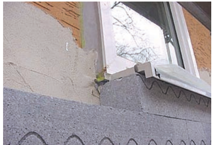
Vastag hőszigetelő rendszer alkalmazásakor, ha a nyílászáró nem a falszerkezetbe, hanem a hőszigetelő rendszerbe van beágyazva az veszélyes lehet

A homlokzati tűzterjedés vizsgálat során fa keretszerkezetű nyílászáró van beépítve, redőnytok, keretmagasítás nélkül. Az új építésű épületekben ettől eltérő kialakítású, műanyag nyílászárókat építenek be. Mindezt többnyire hőszigetelő hab anyagból kialakított redőnytokkal, vagy áthidaló helyett tokmagasítással, amelyre ha rátakar az éghető hőszigetelő maggal rendelkező homlokzati hőszigetelő rendszerünk, ez egy épülettűz során jelentős kockázatot jelenthet.