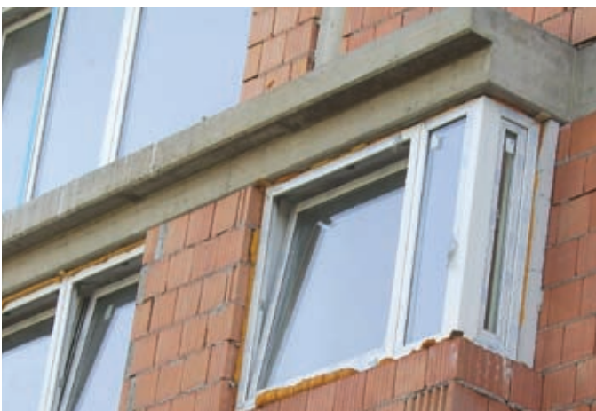
A PUR habbal a biztonság elvész