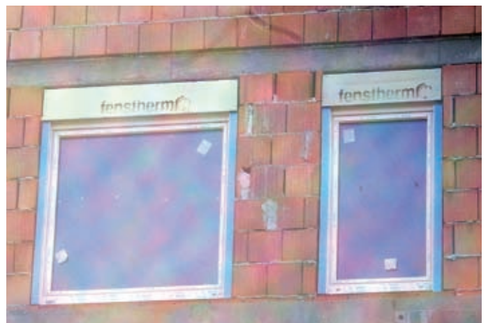
Áthidaló helyett tokmagasítás, épülettűznél jelentős kockázattal jár